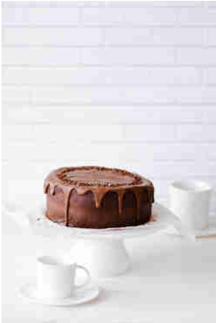
Zum 5. Bloggeburtstag gab's bei Maria Schokotorte mit Zwetschgen

in einer Dachgeschosswohnung gemacht. In vermeintlich dunklen Wohnungen kann man mithilfe eines Stativs trotzdem wunderschöne Fotos machen, also bitte nicht den Mut verlieren.