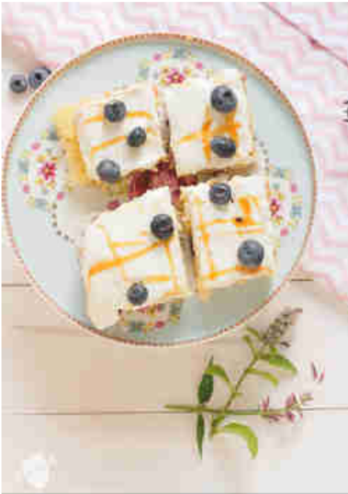
Blaubeerkuchen mit Quark-Joghurt-Topping und Salzkaramell