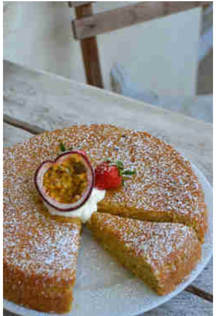
Joghurtkuchen mit Maracuja-Sirup

Dieser Kuchen ist schnell gemacht und wunderbar leicht. Dank Polenta und cremigem Joghurt ist er luftig-locker und zergeht geradezu auf der Zunge. Der Maracuja-Sirup verleiht ihm eine angenehme Süße. Zum Rezept