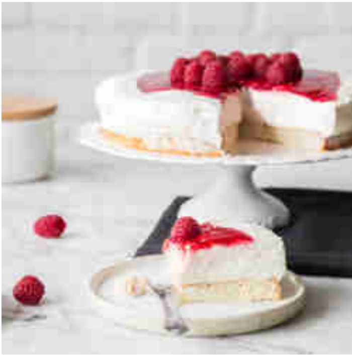
Joghurttorte mit Himbeeren