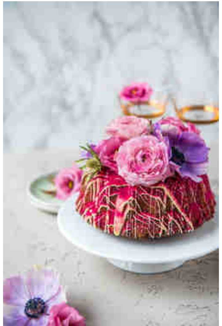
Pistazien-Eierlikör-Kuchen mit griechischem Joghurt

Dieser hübsche Guglhupf zieht alle Blicke auf sich! Aber auch die inneren Werte können sich sehen lassen: Dank Eierlikör ist er herrlich aromatisch. Griechischer Joghurt macht ihn wunderbar saftig. Zum Rezept