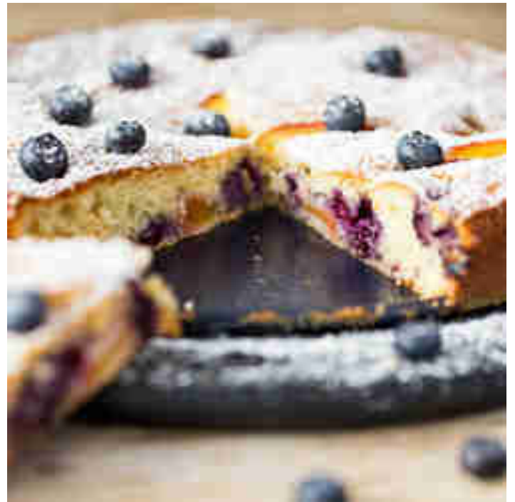
Joghurt-Tarte mit Pfirsichen und Blaubeeren

Kuchenhunger packt. Pfirsiche und Blaubeeren machen sie unschlagbar saftig. Zum Rezept