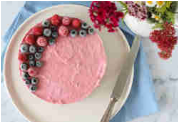
No Bake Kuchen mit Blaubeeren und Himbeeren