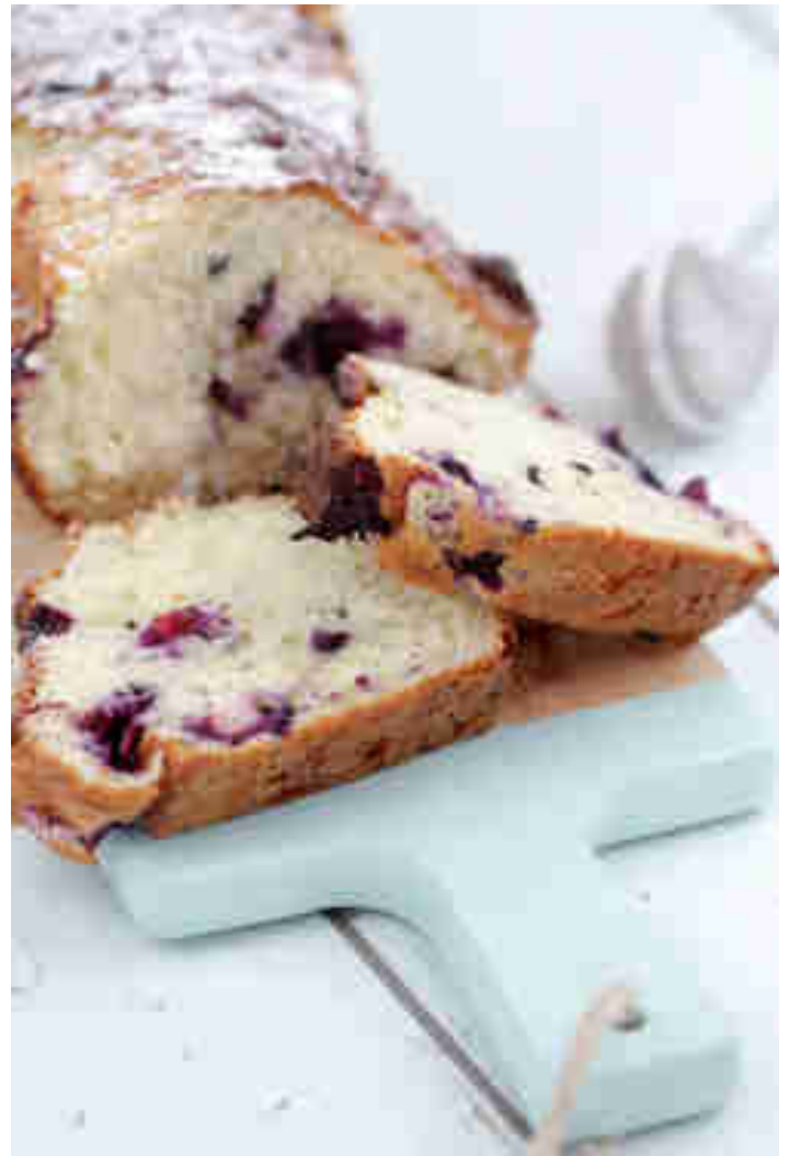
Schneller Quarkkuchen mit Heidelbeeren

50 Minuten Backzeit sind dir schon zu lang? Es geht noch schneller. Jennys Kuchen ist einer von der ganz fixen Sorte. Kurz alle Zutaten zusammenrühren und dann alles knackige 30 Minuten in den Ofen schieben. Der perfekte Kuchen, wenn sich die Nachbarin spontan zum Plausch ankündigt. Zum Rezept