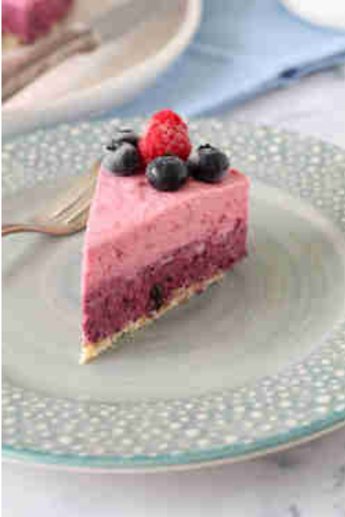
No-bake-Kuchen mit Blaubeeren und Himbeeren

Ines' Kuchen ist zwar keiner von der schnellen Sorte, aber das Warten lohnt sich. Nachdem du Schicht um Schicht aufeinandergetürmt hast und dem Kuchen eine Verschnaufpause im Kühlschrank gegönnt hast, wirst du mit einem rosafarbenen Sommertraum belohnt. Zum Rezept