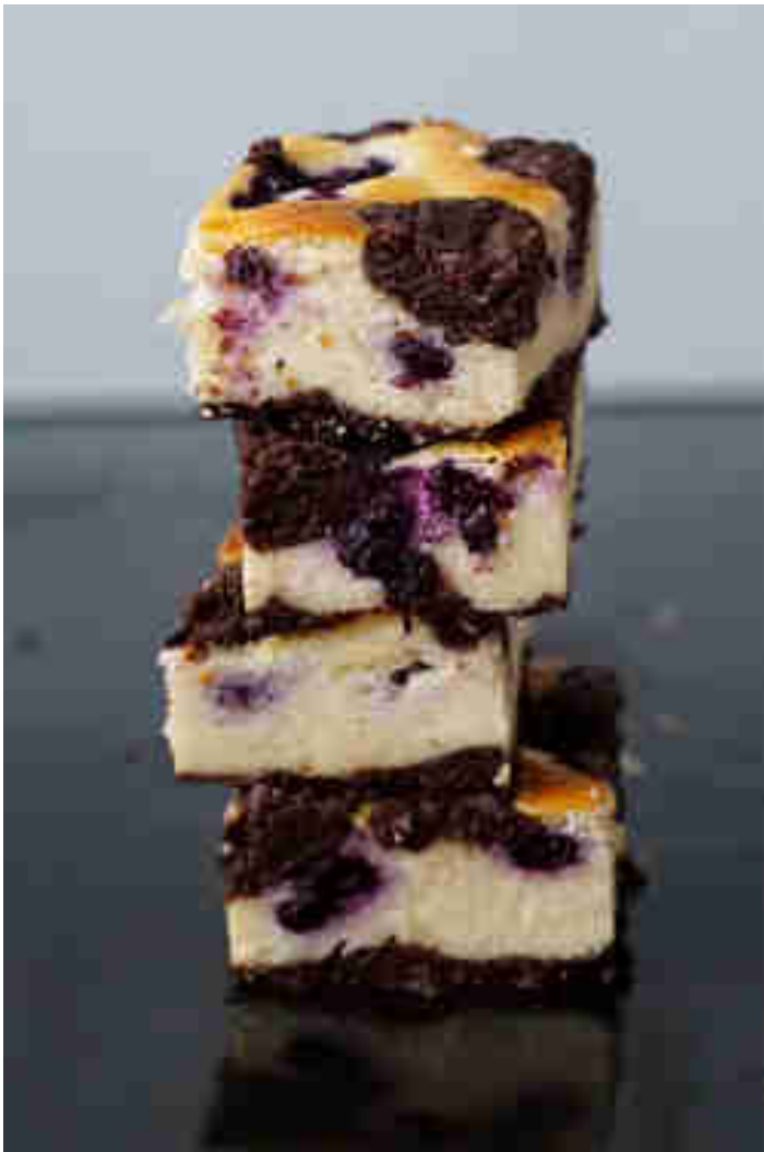
Zupfkuchen mit Heidelbeeren © Sonja Zug | Zauberhaftes Küchenvergnügen