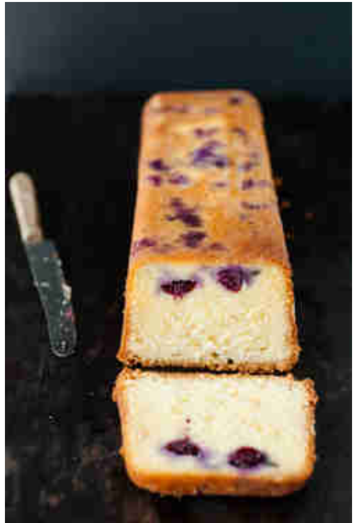
Blaubeerkuchen mit Holunderblütensirup

Es war nie einfacher, sich ein großes Stück Sommerglück zu backen. Alles, was du brauchst, sind Blaubeeren, Olivenöl und Holunderblütensirup, die es sich in süßem Dinkelrührkuchen gemütlich machen. Zum Rezept