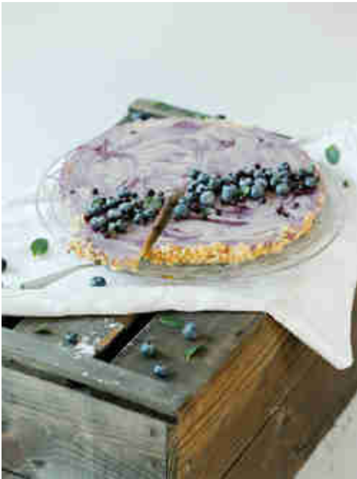
Blaubeertarte mit Keksboden