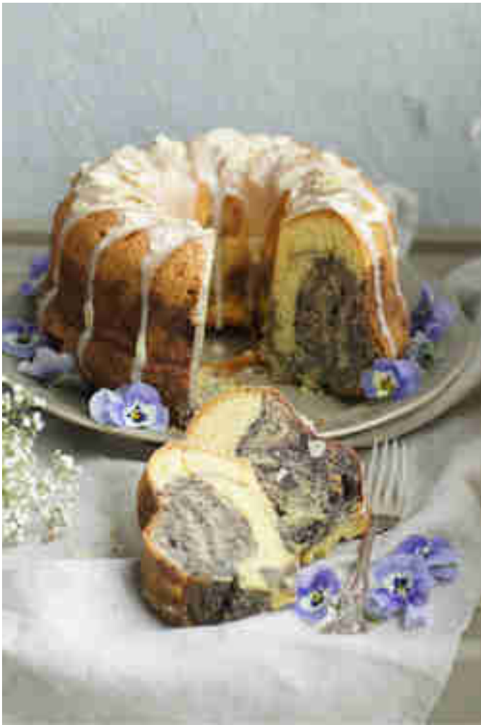
Blaubeer-Marmorkuchen © Andrea Natschke | Zimtkeks und Apfeltarte