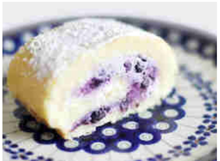
Biskuitrolle mit Heidelbeer-Quark-Füllung

Jessicas Biskuitrolle erfordert zwar etwas Fingerspitzengefühl, hast du den Dreh aber erstmal raus, backst du in der Blaubeersaison so schnell keinen anderen Kuchen mehr. Zum Rezept