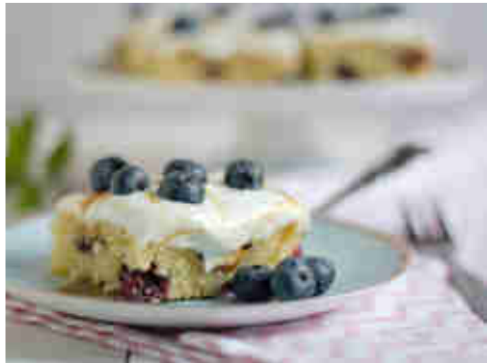
Blaubeerschnitten © Julia Zimmermann | Naschen mit der Erdbeerqueen

Egal, welches Fest als nächstes ansteht – von Geburtstag bis Taufe – mit Julias Kuchen liegst du immer richtig. Steht der Kuchen mit luftigem Boden, Joghurt-Quark-Topping und feinem Salzkaramell auf dem Buffet, ist er schneller weg, als du „Buffet ist eröffnet“ sagen kannst. Zum Rezept