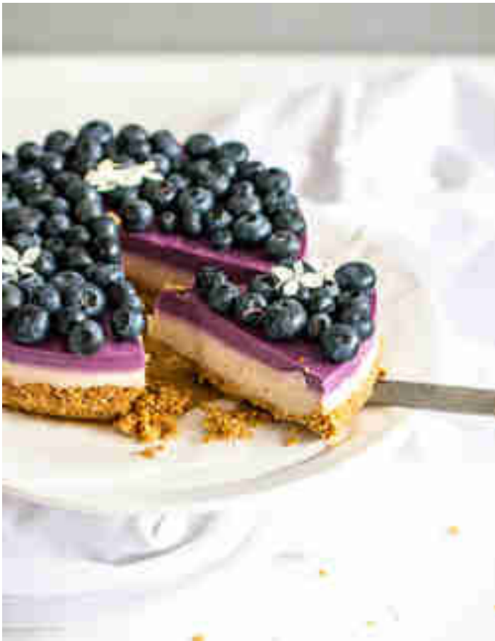
Joghurttörtchen mit Heidelbeeren