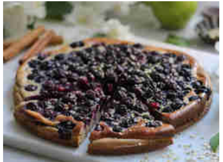
Veganer Heidelbeerkuchen

Wenn Heidelbeeren auf Zimt, Apfel und Vanille treffen, dann ist die große Schlemmerei schon vorprogrammiert. Und in diesem Fall sogar ohne schlechtes Gewissen. Zum Rezept