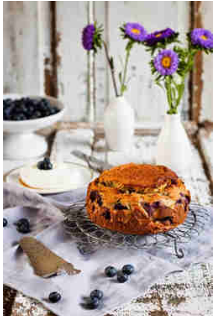
Glutenfreier Blaubeerkuchen

Blaubeerkuchen für alle! So lautet zumindest Cornelias Devise. Denn nur weil man kein Gluten oder Laktose verträgt, muss man ja nicht auf leckeren Blaubeerkuchen verzichten. Richtig so. Denn auch ohne kann der Kuchen zu einem zweiten Stück verführen. Zum Rezept