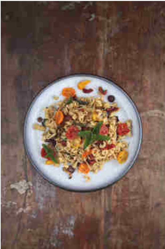
Pasta-Salat mit Basilikum-Dressing