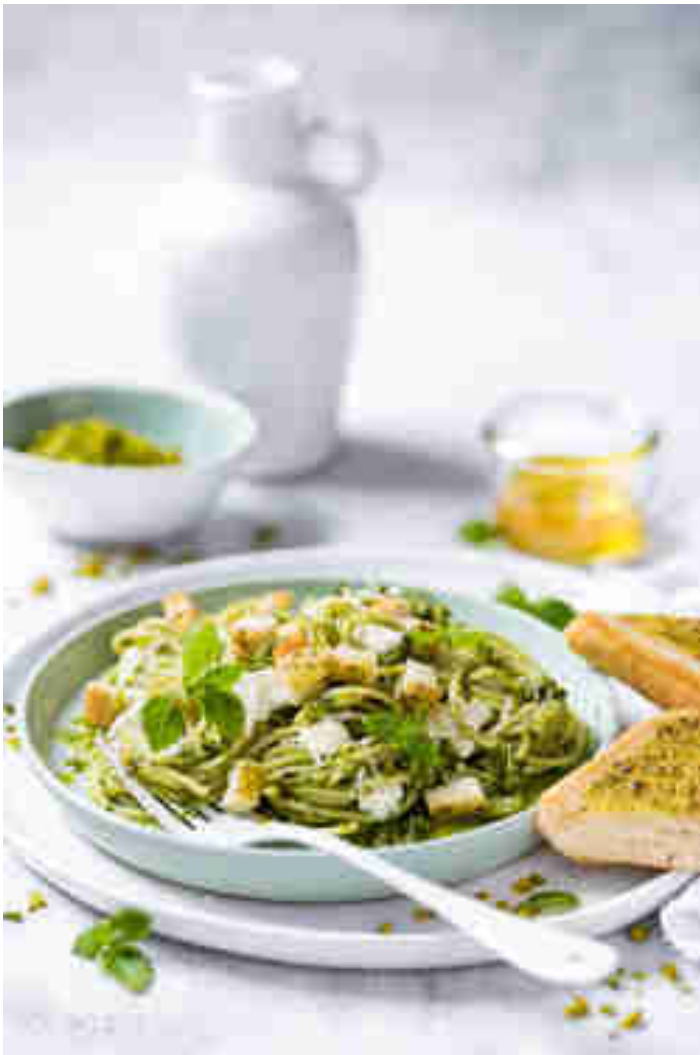
Pasta mit Pistazien-Pesto