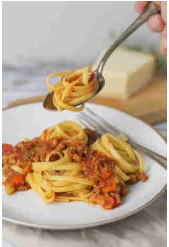
Spaghetti Bolognese

Bei Mama schmeckt's doch einfach am besten! Oder eben bei Papa. Vor allem, wenn dabei der Klassiker Spaghetti Bolognese mit würzigem Hack, fruchtigen Tomaten und mediterranen Gewürzen auf den Tellern landet. Ines entführt uns mit ihrem Rezept nach Bella Italia und macht La Dolce Vita zum Greifen nah. Zum Rezept