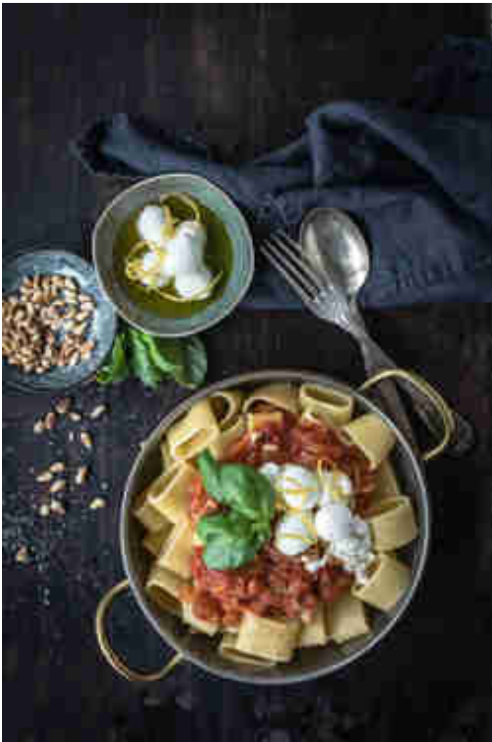
Pasta all'Amatriciana