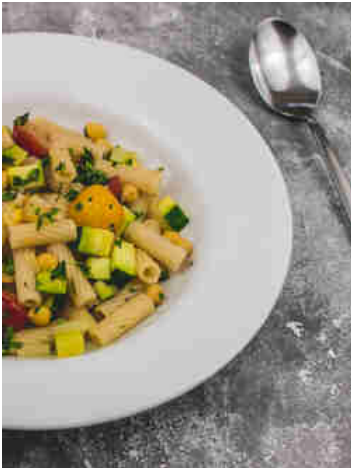
Nudelpfanne mit Zucchini & Kichererbsen