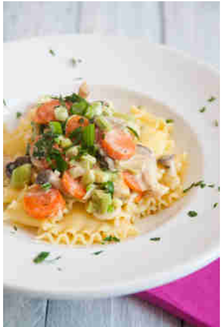
Lasagnette mit Kräuterseitlingen © Sabrina Kiefer & Steffen Jost | Feed me up before you go

“Ihh, da ist ja Grün drin!” – Kennst du von deinen mäkeligen Minis zu Hause? Gemüsiger Widerwille hat sich dank Sabrinas und Steffens Rezept gegessen! Die beiden kombinieren herrlich wellige Lasagnette, die sich auf dem Teller richtig schön mit cremiger Sauce vollsaugen und in der das knackig-frische Gemüse vor lauter Genuss fast gar nicht auffällt. Zum Rezept