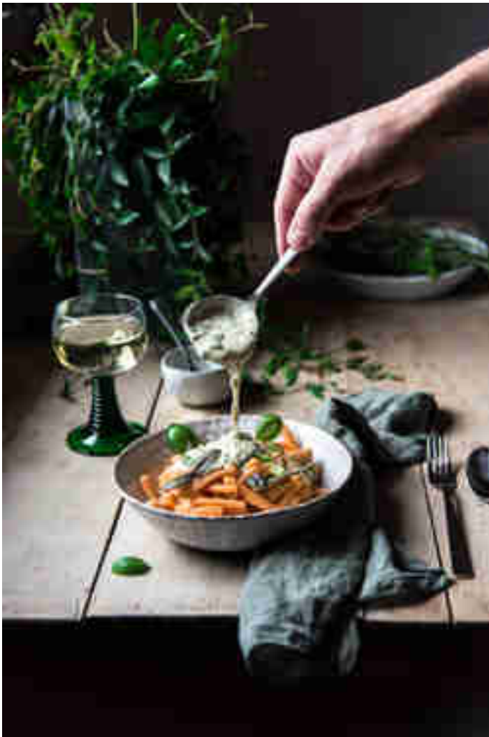
Pasta mit Kräuter-Sahne-Sauce