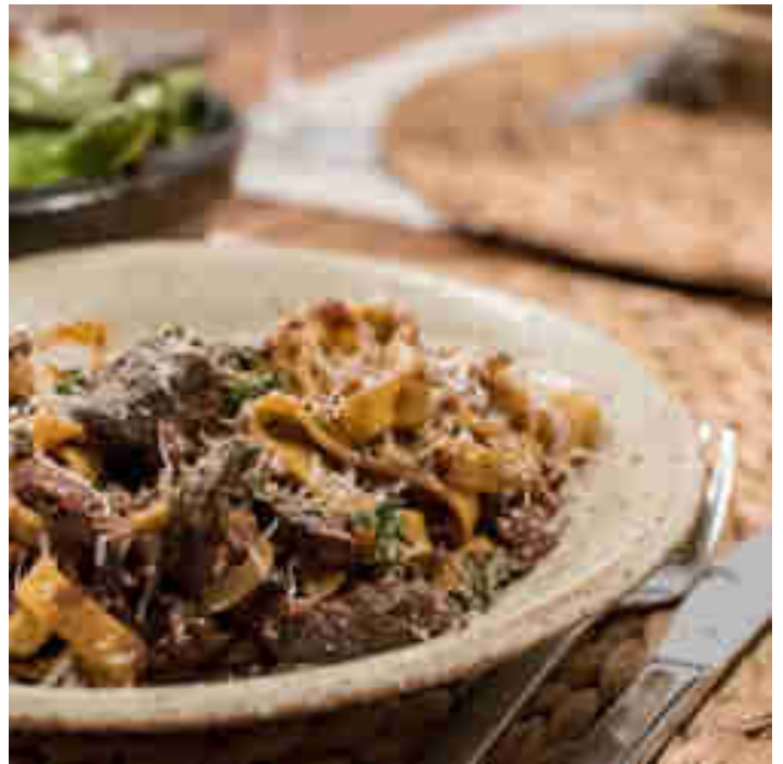
Glutenfreie Pasta mit Hähnchenleber, Rotwein und getrockneten Tomaten

Für die Abende, wenn die Kinder schon im Bett sind. Oder bei Freunden. Für die Abende, an denen du und dein Herzensmensch euch auch mal zuprosten wollt für eure Kochkünste und mehr vom Hähnchen als nur das Brustfilet auf dem Teller landen soll. Für solche Abende landet bei Corinna zart-würzige Hähnchenleber mit einem Gläschen Rotwein und aromatischen getrockneten Tomaten in der Pfanne und im Anschluss auf euren liebsten nudeligen Gabelschmeichlern. Zum Rezept