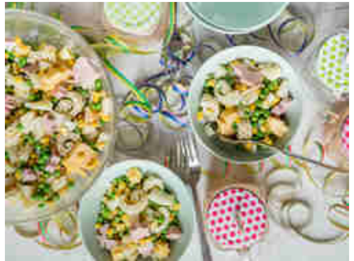
Bunter Nudelsalat für Kinder