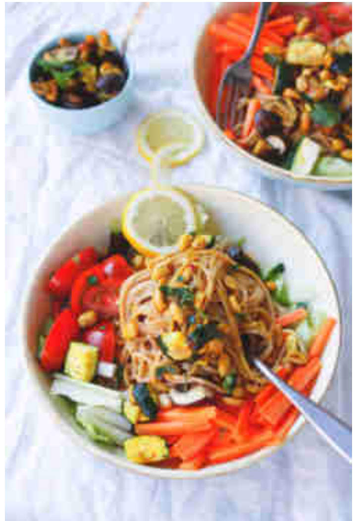
Vollkornspaghetti mit Gemüse und Erdnuss-Sojasoße

Bunt, bunter, Bowls! Julia beweist uns, dass ein fantastisches Abendessen gar nicht mehr als drei Komponenten braucht: Gemüse – Sauce– Nudeln. Wenn das Ganze dann noch mit erdnussigem Sojasaucenextra in die Schüssel wandert, hat sich der Hunger ganz schnell gegessen. Zum Rezept