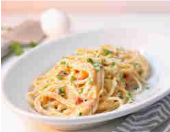
One Pot Pasta alla Carbonara