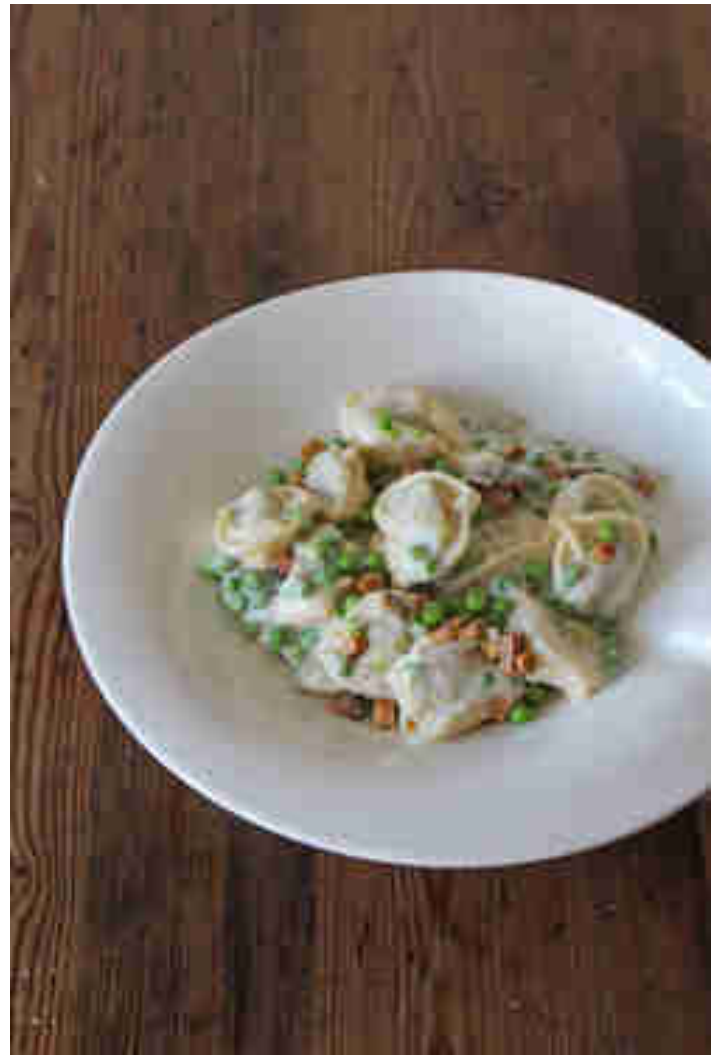
Tortellini alla Panna

Du möchtest deiner Familie etwas Gutes tun und auch mal auf Fleisch und tierische Produkte verzichten? Ela zeigt dir wie und beweist, wie Italienisch und bunt vegan geht! Ihre extra cremigen Tortellini alla Panna mit knackigen Erbsen und knusprigem Räuchertofu wandern super schnell in die hungrigen Mäuler und machen auch die mäkeligsten Esser einfach rundum glücklich. Zum Rezept