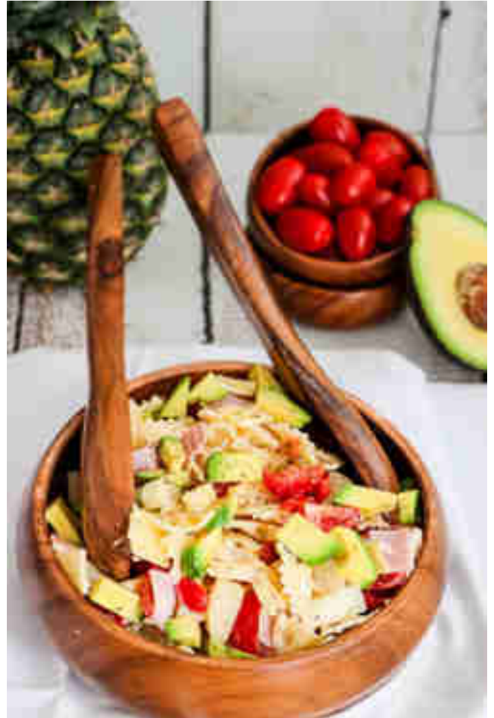
Nudelsalat à la Hawaii

herzhaftem Nudelsalat à la Hawaii sparst du dir das Kofferpacken und hörst trotzdem bei jeder Gabel Meeresrauschen. Zum Rezept