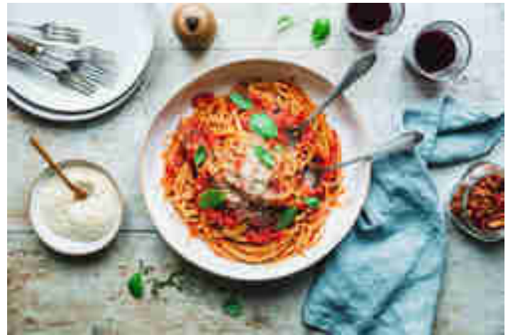
Pasta al Pomodoro

leckersten Kindertage denkst? Bei uns sind es auf jeden Fall Spaghetti mit Tomatensauce! Und was kleine Strolche lieben, bringt genauso große Feinschmecker wie Jörg zum Schlemmen. Seine Deluxe-Version des Klassikers hört auf den melodischen Namen „Pasta al Pomodoro“ und schmeckt darüber hinaus noch besser als von jedem Italiener. Zum Rezept