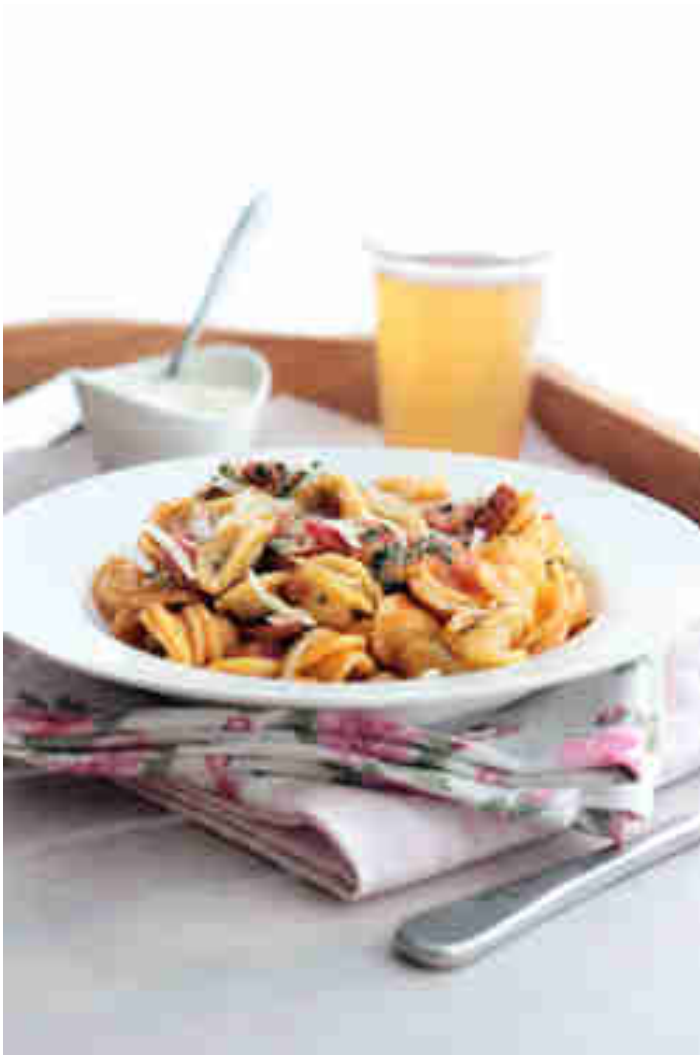
Pasta à la Italia mit Salsiccia und Spinat