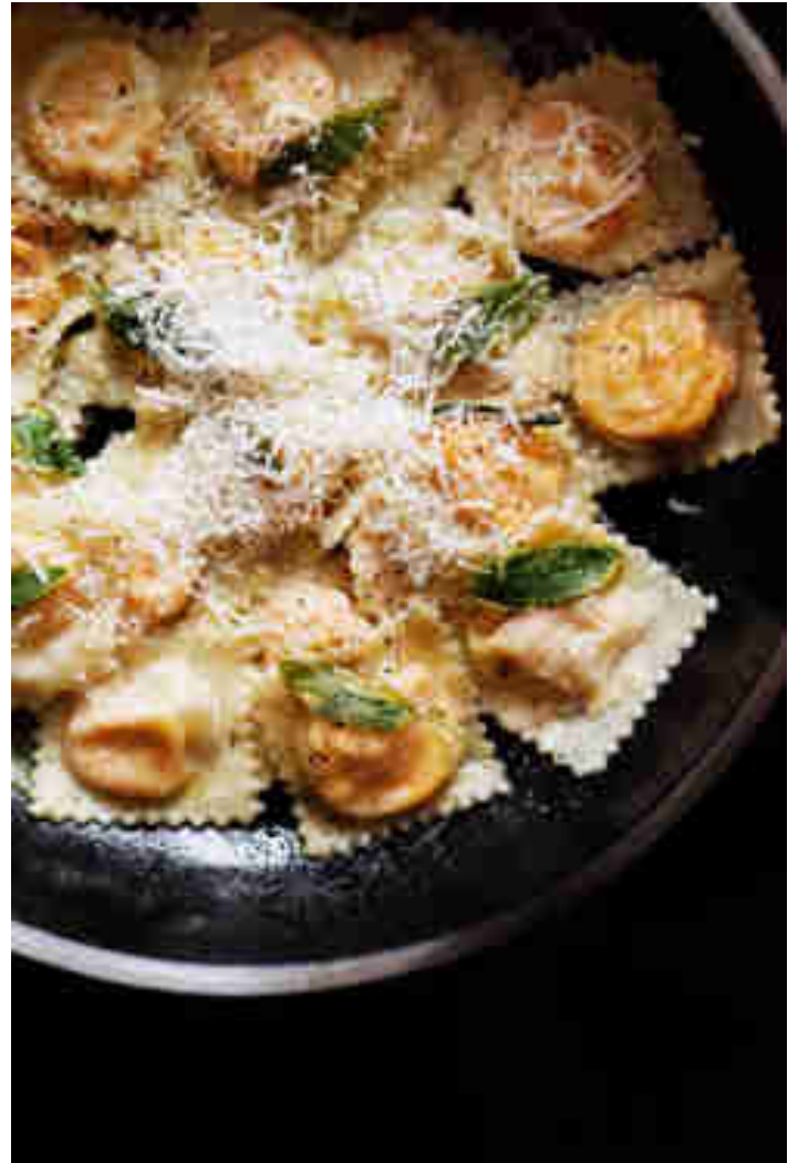
Kürbis-Mascarpone-Ravioli mit Salbeibutter

Was ist wohl das Beste für die Kürbiszeit, wenn die Abende schon wieder dunkler und kühler werden, und du dich am liebsten drinnen aufhältst? Genau, kochen! Sieht Jessica genauso und macht die leckere Sache gleich zu einer Selbstmach-Aktion für die ganze Familie. Eröffne die Kochstationen und fülle mit deinen Lieben wunderbare Ravioli mit Kürbis und Mascarpone! Zum Rezept