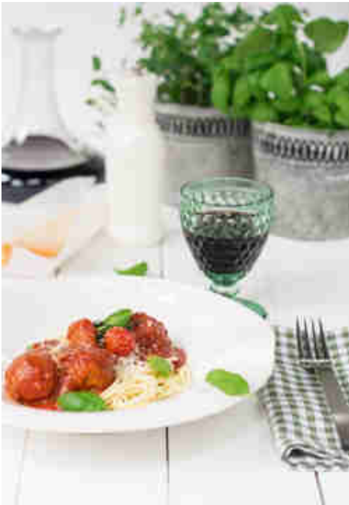
Spaghetti Polpette