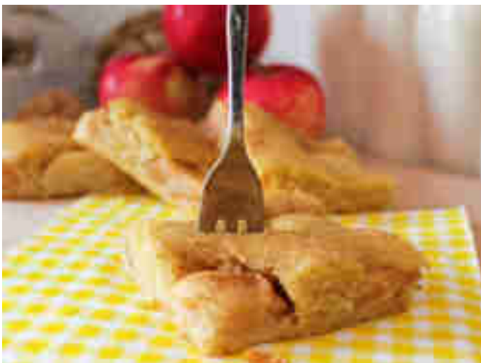
Gesunder Apfelkuchen

„An apple a day, keeps the doctor away“ sagen die Amis, wenn sie die Vorzüge von gesundem Obst anpreisen. Ob das wohl auch für Apfelkuchen gilt? Also für diesen Kuchen bestimmt, der ganz ohne Zucker und Weißmehl für süße Momente sorgt. Zum Rezept