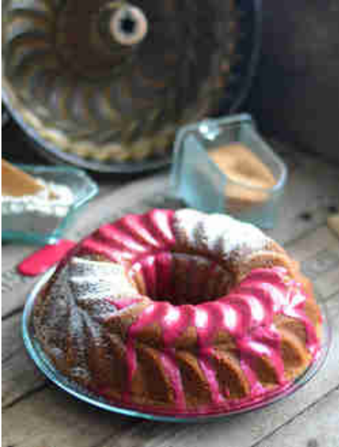
Pastinaken-Apfel-Kuchen © Simone Filipowsky | S-Küche

Pastinake und Rote Bete gehören vielleicht nicht zu den klassischen Backzutaten, kommen hier jedoch ganz groß raus. Zum Rezept