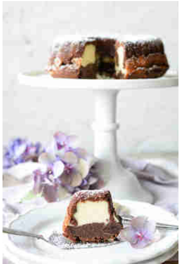
Schokoladenkuchen mit Cheesecakefüllung