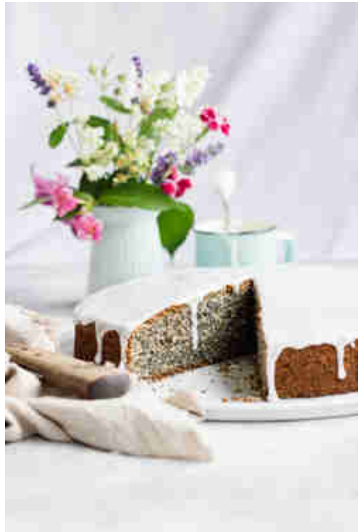
Polnischer Mohnkuchen

Charmeure der alten Schule wissen halt, wie's geht. Piegusek ist ein polnischer Kuchenklassiker, der dir den Tag mit Mohn und Quark-Topping versüßt. Zum Rezept