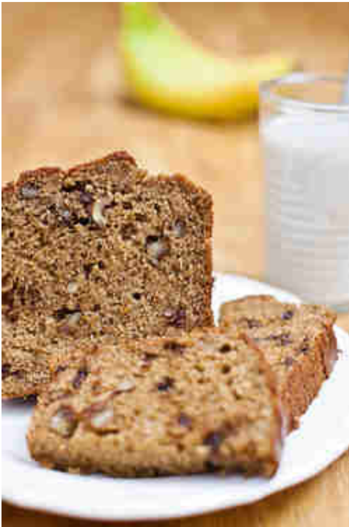
Bananenbrot-Rührkuchen © Irina Lauterbach | Lecker macht Laune