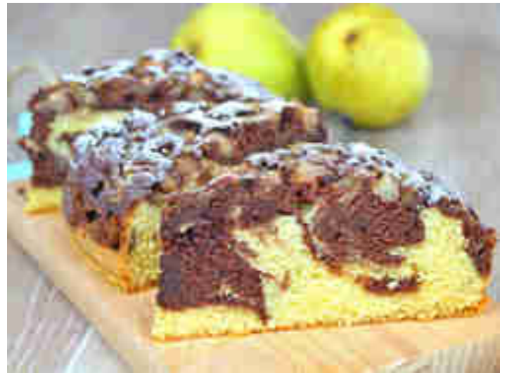
Marmorkuchen mit Birnen

Wenn sich deine guten Vorsätze auch um dein Naschverhalten drehen, haben wir eine gute Nachricht für dich: Kuchen gibt's auch in figurfreundlich. Veronique zeigt dir, wie Marmorkuchen lecker und kalorienarm auf der Kaffeetafel landet. Zum Rezept