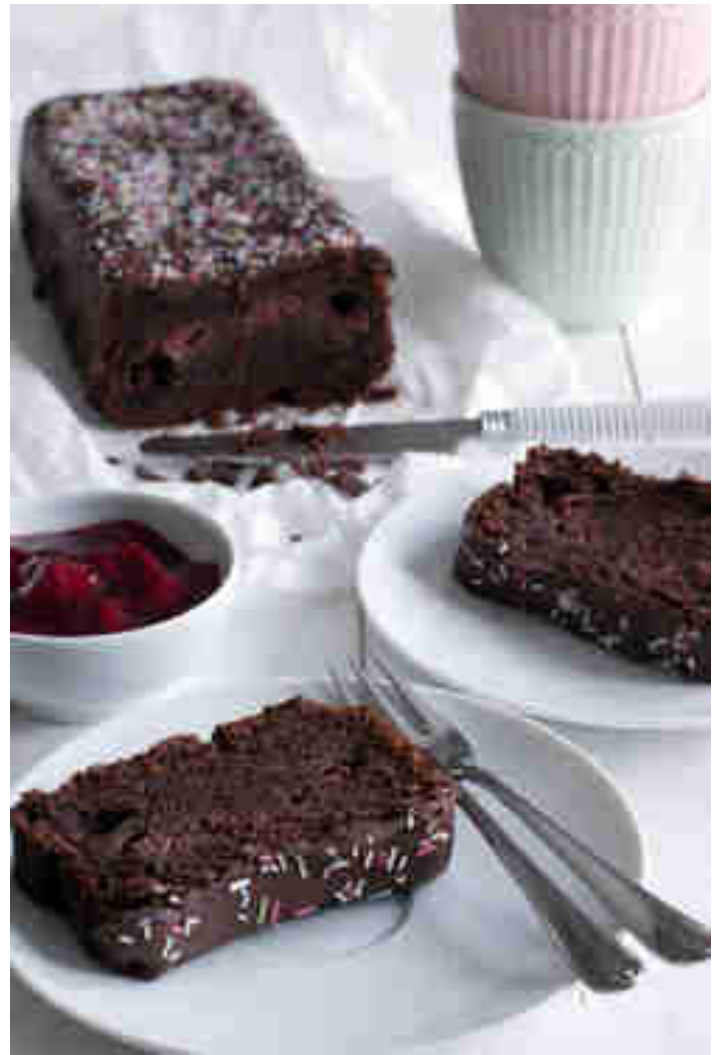
Schokoladenkirschen mit Zimtkirschen

Bei Nileen Marie bringt uns der fudgy Schokokuchen schwer in Versuchung. Aber als wir im Kuchenteig Zimtaroma und fruchtige Sauerkirschen entdecken, ist es dann völlig um uns geschehen. Zum Rezept