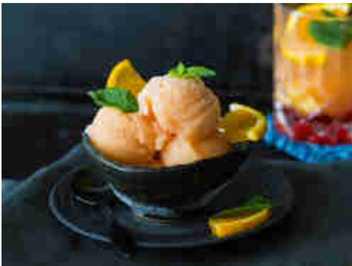
Orangen-Sorbet mit Campari

Campari und O-Saft sind eine gute Kombi für alle, die gegen Schwips im Dessert nichts einzuwenden haben. Leicht, fruchtig und sommerlich – also einfach perfekt für laue Sommerabende. Zum Rezept