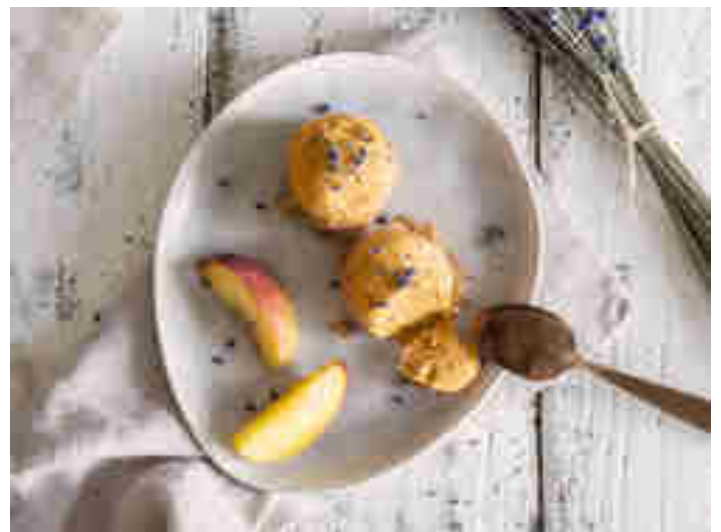
Pfirsich-Sorbet mit Lavendelblüten

Leuchtende Pfirsiche und reife Bananen lassen fast immer gute Laune aufkommen. Umso mehr, wenn sie bei 30 °C im Schatten als eiskaltes Sorbet serviert werden. Noch ein bisschen mehr WOW gefällig? Dann streu als Topping getrocknete Lavendelblüten über die Kugeln. Zum Rezept