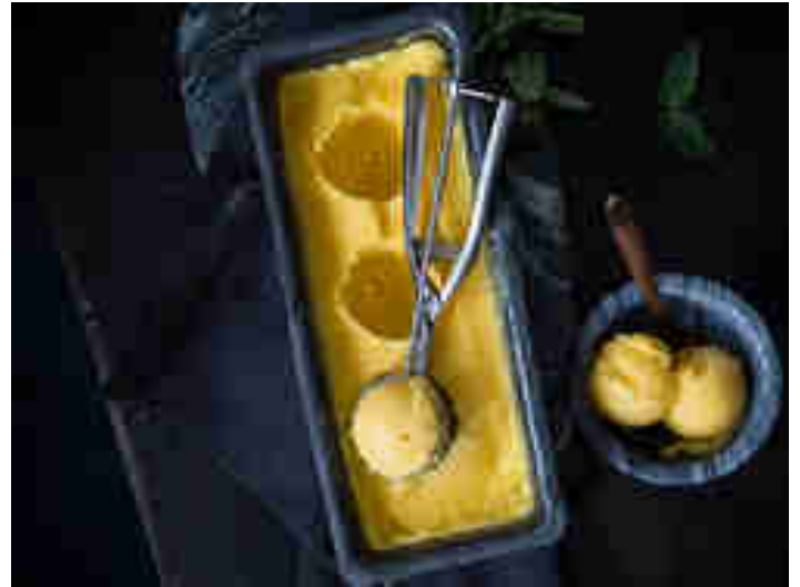
Mango-Sorbet mit Kokosmilch

Auch aus der Kategorie Fernweh: Dieses Mango-Sorbet ist dank Kokosmilch und einem Hauch Vanille ein ganz heißer Anwärter auf den Titel „Coolste Sommer-Erfrischung des Jahres“. Wie du voten kannst? Also erst mal gaaanz viel verkosten. Zum Rezept