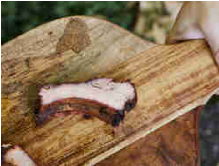
Gegartes Rippchen mit Smokering unter der Kruste

Bei deinen Rippchen ist das genau dasselbe Prinzip. Allerdings „konservieren“ der im Rauch enthaltene Kohlenstoff und Stickstoffmonoxid das Myoglobin-Protein. Die Folge ist, dass ein kleiner Rand unter der Kruste rosa bleibt, während der Rest des Fleisches durchgart und sich gräulich verfärbt.