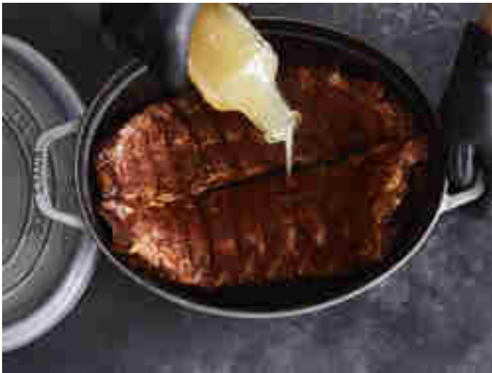
Rippchen werden mit Apfelsaft und Cidre angegossen