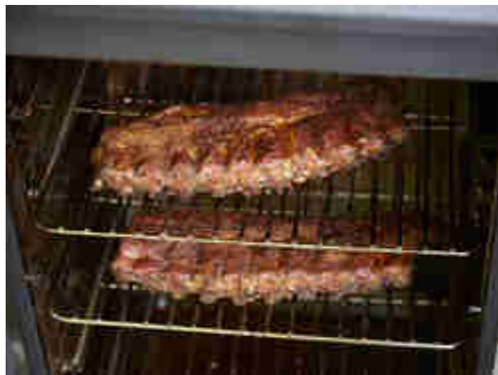
Noch nicht auf den Punkt gegarte Rippchen