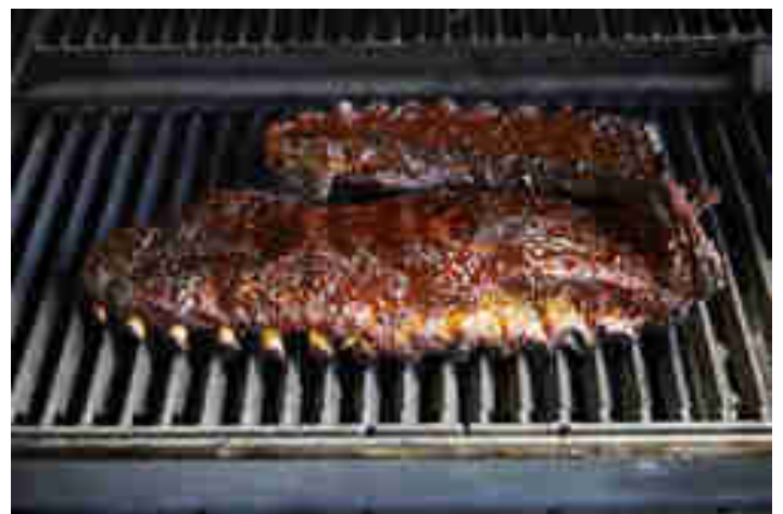
Fertig gegarte Spare Ribs im Gasgrill