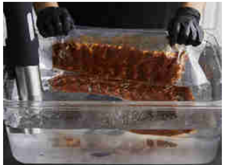
Rippchen vakuumiert im Sous Vide Bad

Gib die Rippchen ins Wasserbad und gare sie 36 Stunden bei 65 °C oder 12 Stunden bei 75 °C.