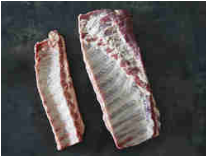
links: Baby Back Cut, rechts: St. Louis Cut