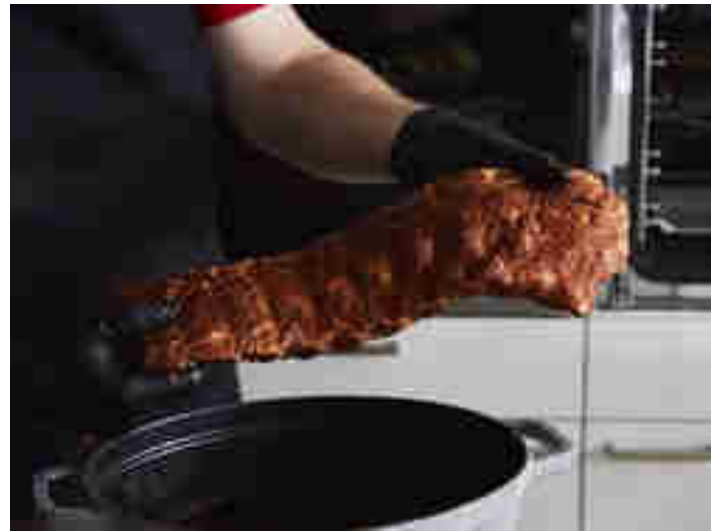
Gerubberte Ribs fertig für die Cocotte

Natürlich ist es schwierig, auf diese Weise eine niedrige und konstante Hitze zu erzeugen. Hier sind daher Briketts und ein Innenraumthermometer Pflicht.