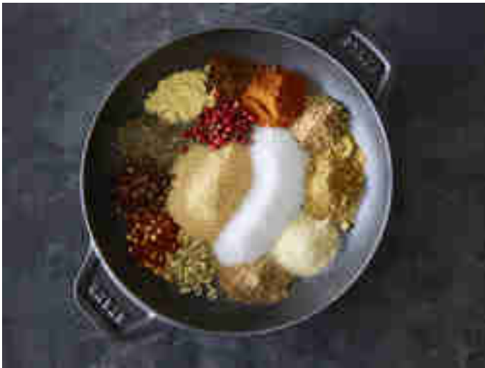
Alle Gewürze für einen Trocken-Rub

Für meinen Standard-Rub brauchst du folgende Zutaten: