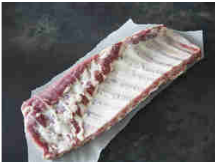
Spare Ribs sind breiter und durchwachsener als Baby Back Ribs

Center Cut/St. Louis Cut/Loin Cut – etwas weiter unten sitzen die Schälrippen . Sie sind länger, flacher, fleischiger und mit mehr Fett durchzogen. Diesen Cut musst du auf jeden Fall bei einem Metzger bestellen oder online ordern.