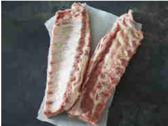
Baby Back Ribs mit charakteristischer Biegung der Rippenknochen

Back Ribs/Baby Back Ribs/Loin Ribs – direkt an der Wirbelsäule (englisch "Backbone" liegen die Kottelet-Rippchen/Leiterchen . Sie sind leicht gebogen, liegen dicht nebeneinander und der Großteil des Fleisches sitzt an der Oberseite. Dieser Cut ist bei uns in Deutschland der verbreitetste. Du bekommst ihn bei jedem Metzger und an jeder Fleischtheke ohne Vorbestellung.