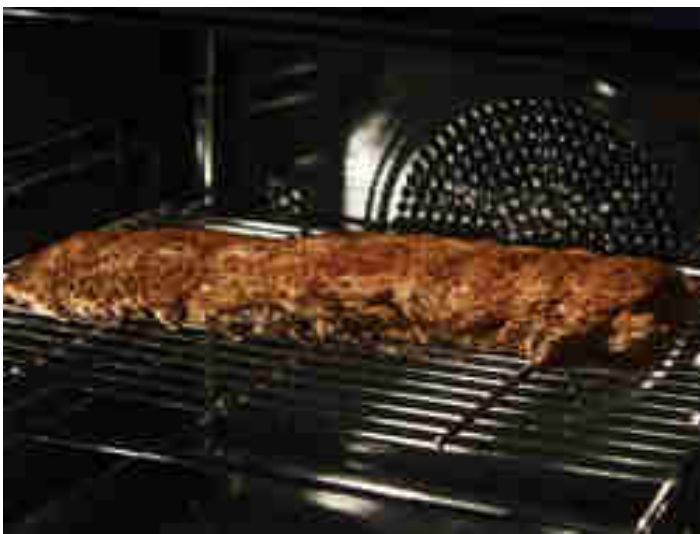
Baby Back Ribs nach 3 Stunden im Ofen

Es regnet in Strömen draußen, oder du hast bis jetzt noch keinen Grill? Auch in deinem Ofen kannst du wunderbare Spareribs zubereiten.