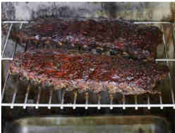
Sous Vide gegarte Rippchen im Ofen kross gegrillt

Alternativ kannst du auch einen Lötbrenner oder die Grillspirale in deinem Backofen verwenden, um die Rippchen darunter anzuknuspern.