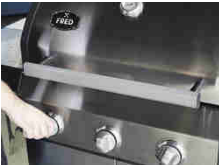
Einstellung des Gasgrills für Spare Ribs