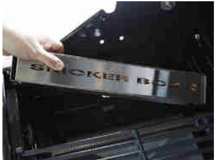
Einsatz der Smokebox über den Edelstahlbrenner