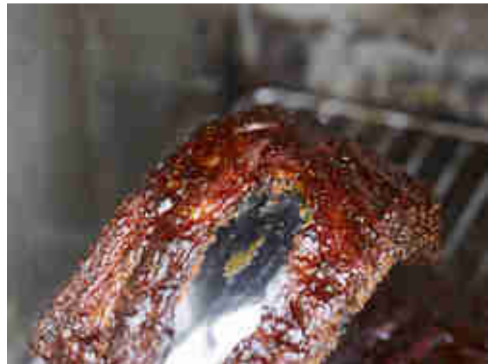
„Bend“ Test bei Rippchen