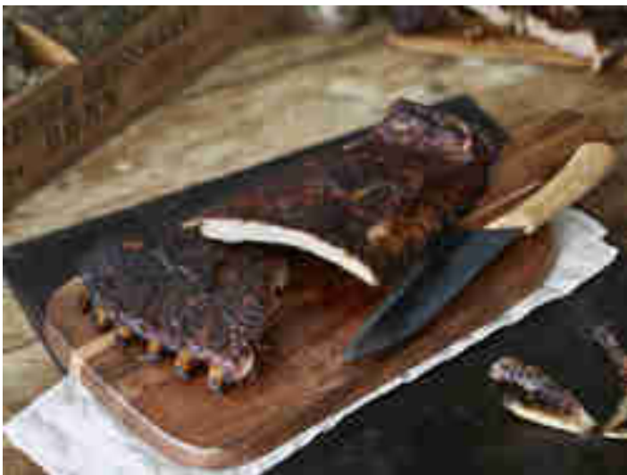
Auf dem Gasgrill knusprig angegrillte Rippchen.